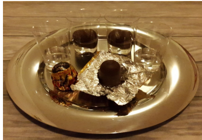
Der Jokerkuss - Auge zue und aabe dermit

J wie Jokerkuss unsere aigene Kult-Shot - Zwätschgewasser, Moorekopf drii.