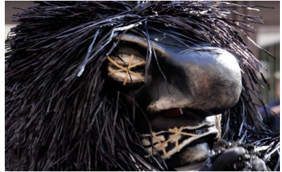
Fasnacht 2012: "Fondation Culture Morte"

JOKER WAGGIS bis hit e Highlight. Bis deert hii wool s'bescht und s'intelegguellscht Sujet, paart mit em erschte groosse Uffbau uff em Waage und derzue e grandioosi Laarve - es het aifach alles passt!