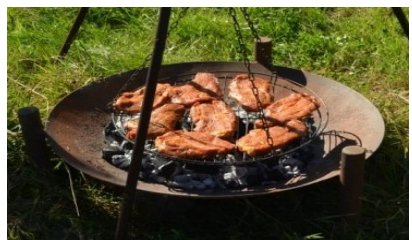
... Steaks zem Hauptgang, oder lieber doch e Stiggli Kueche? Fir jeede ebbis derby!

Doch nit numme der Smoker isch guet gfillt gsi, au der Grill, d'Salat-Bar oder speeter s'Dessert-Buffer