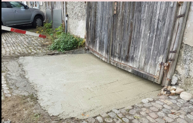
Wiider geebnet: Die neu Garage-Yyfaart

Als näggschts het me sich drum um d'Garage-Yyfaart kimmeret. Denn fir aifachers iine- und uusefaare, isch s'Eebne dringend neetig gsi.