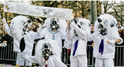
Fasnacht 2003: Miir sinn mit em Velo doo

Au vor der Fasnacht 2003 isch me allewyyl erscht an dritter Stell vo der Wartelichte gsi. Me het sich also wiider ebbis miesse yyfalle loo. E wyteri Glygge-Partnerschaft isch fir d'JOKER WAGGIS deertmols nit in Froog koo, esoo het me sich entschlosse, us alte Velos zwai Gfäärt z'baschtle. Au wenn's am Cortège gweenigsbedirftig gsi isch, isch's am Änd ainewääg e scheeni Fasnacht worde. Und nadyrlig het me sich e glaini Protäscht-Aggzioon bim Comité nit kenne vergnaiffe!