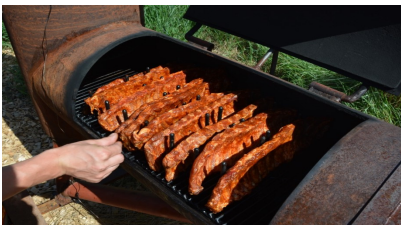
Spare Ribs vom Smoker zer Vorspys ...

Diesmol isch aber alles e weeneli andersch gsi, denn im Jubiläums-Fasnachts-Joor hän sich d'JOKER