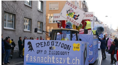
Fasnacht 2008: Mit Volldampf in d'Zuekunft

Nach der offizielle Uffnaam vom Comité uff d'Fasnacht 2007, het me denn im Fasnachts-Joor 2008 mit der Garage in Birsfælde no e neue Waagebau-Platz bezooge.