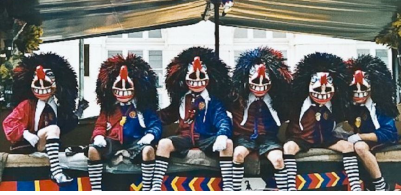
"Zrugg ins Joggeli" oder "Hanfdampf"?!?

Drum isch es au zumene kuriose Momänt koo, wo der Waage im Fäärnsee duur s'Bild gfaare isch. Denn zur Waagesytte vo de JOKER WAGGIS - wool gmergt mit säggs FCB-Waggis im Bild - maint der Kommentator kurz und drogge: "Jetz gseen miir d'Balggebieger mit iirem Sujet Hanfdampf!"